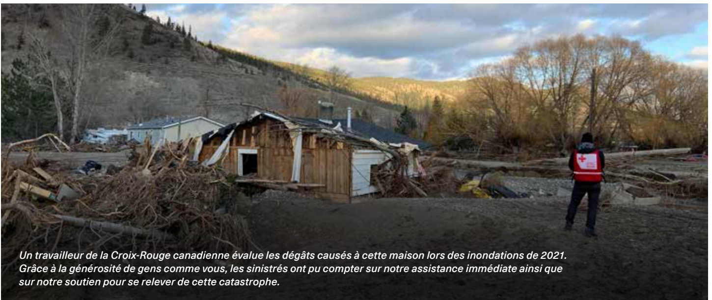
Un travailleur de la Croix-Rouge canadienne évalue les dégâts causés à cette maison lors des inondations de 2021. Grâce à la générosité de gens comme vous, les sinistrés ont pu compter sur notre assistance immédiate ainsi que sur notre soutien pour se relever de cette catastrophe.

Président et chef de la direction Croix-Rouge canadienne